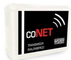
CONET TRANSMISOR INALÁMBRICO